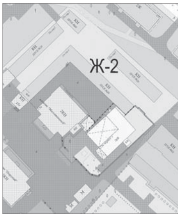
Ж-2 - территориальная зона застройки малоэтажными и среднеэтажными жилыми домами