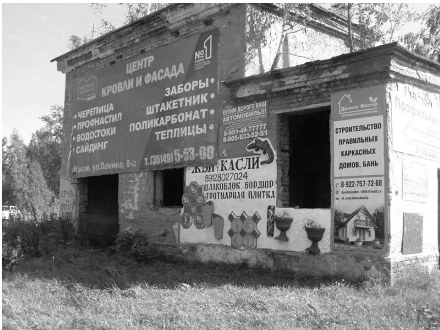
Ткачук З.З. 2-45-76