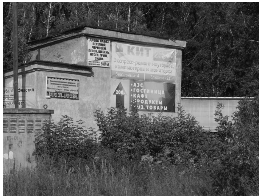
Ткачук З.З. 2-45-76