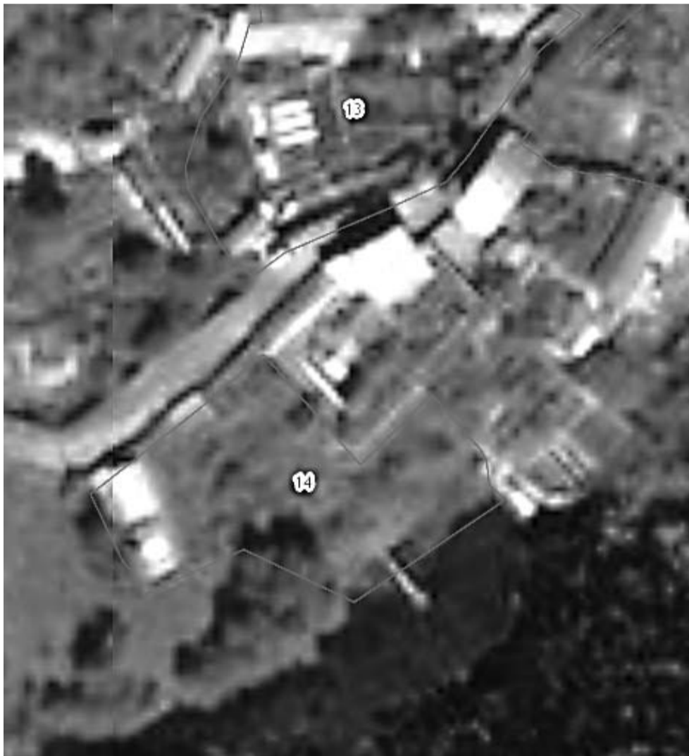
Ж-4 - территориальная зона садоводств и дачных участков

Графическое изображение фрагмента Карты градостроительного зонирования Правил землепользования и застройки в городе Озерске (статья 50) Земельный участок с кадастровым номером 74:41:0116018:14 (СНТ «Зеленая горка», ул. Береговая, участок № 1)